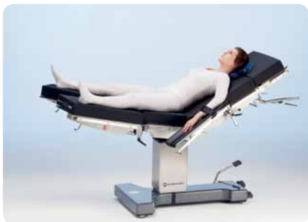
Позиция литотомии с разделенной ножной секцией, например, для лапароскопии и бариатрической хирургии