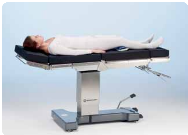
Обратное положение для общей или ЛОР-хирургии.