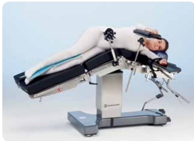
Латеральное положение для общей хирургии без опоры для операции на почках.