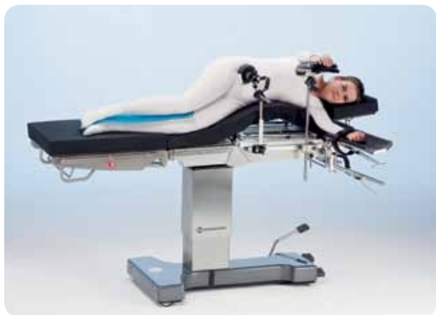
Латеральное положение с flex или с опорой для операции на почках для операции на почках/ торакальной хирургии.