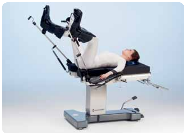
Позиция литотомии с опорами для ног, например, для гинекологии/урологии