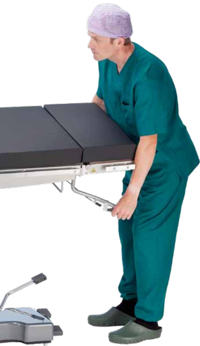
Боковой наклон с помощью газовой пружины