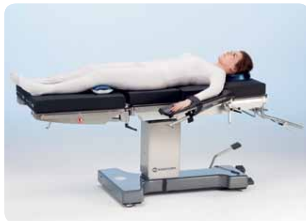
Положение «лежа на спине» для общей хирургии.